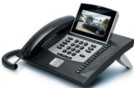
COMfortel 3600 IP

KOSTENSPAREND, MULTIFUNKTIONAL UND AUSBAUFÄHIG